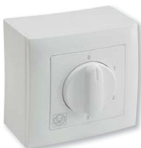
ДхШхВ (мм): 86 x 86 x 60,4

Настенный пульт управления для двухскоростных вентиляторов. Кнопка "Вкл."/"Выкл." Кнопка переключения скорости I/II. Максимальный ток: 4,5 А.