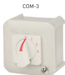
ДхШхВ (мм): 90 x 90 x 75