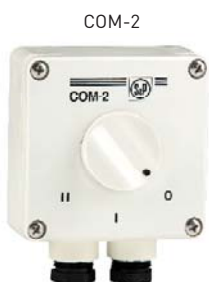
ДхШхВ (мм): 84 x 37 x 81

Настенный пульт управления для трехскоростных вентиляторов. Переключение положений "Вкл."/"Выкл." и скоростей 1/2/3 осуществляется одной поворотной ручкой. Максимальный ток: 4А.