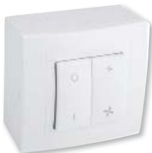
ДхШхВ (мм): 80 x 45 x 80