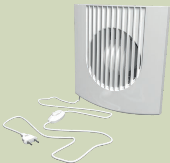
Вентилятор с опцией -01 оснащён сетевым кабелем и вилкой