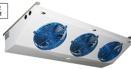
Fin Space: 片距 4.5mm