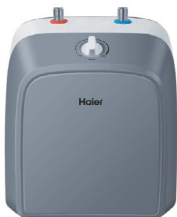
ES10V-Q2(R) Монтаж под мойкой