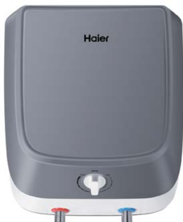
ES10V-Q1(R) Монтаж над мойкой