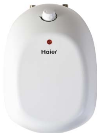
ES8V-Q2(R) Монтаж под мойкой