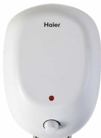
ES8V-Q1(R) Монтаж над мойкой